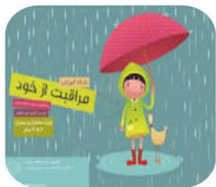
واحد آموزش سلامت